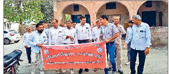
सोनीपत। विरोध प्रदर्शन करते हरियाणा विद्यालय अध्यापक संघ के पदाधिकारी।