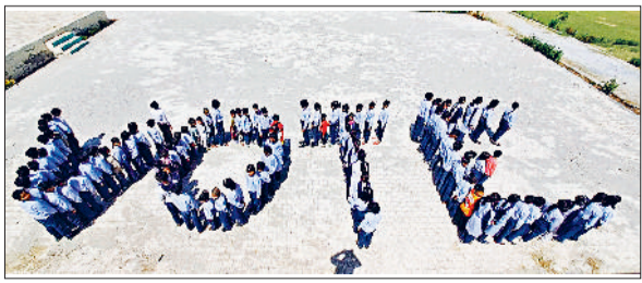
गोहाणा। विद्यार्थी मानव श्रृंखला से मतदान जागरूकता संदेश देते विद्यार्थी।