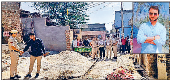
सोनीपत। वारदात स्थल पर जांच करते हुए पुलिस व एफएसएल की टीम तथा (इनसेट में) मृतक का फाइल फोटो।

नागरिक अस्पताल में फॉरेंसिक चिकित्सक न होने के चलते शव को महिला मेडिकल कॉलेज अस्पताल खानपुर में रेफर कर दिया। जहां पुलिस ने शव को पोस्टमार्टम करवाकर परिजनों को सौंप दिया। पुलिस टीम हमलावरों की तलाश कर रही है। गांव मोहाना