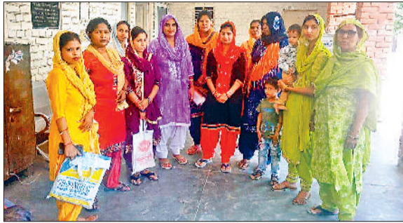
सोनीपत। शिकायत लेकर खंड शिक्षा अधिकारी कार्यालय में पहुंचे अभिभावक।

ऐसे विद्यार्थियों के अभिभावकों ने वीरवार को खंड शिक्षा अधिकारी कार्यालय में विरोध प्रदर्शन किया। प्रदर्शन के उपरांत