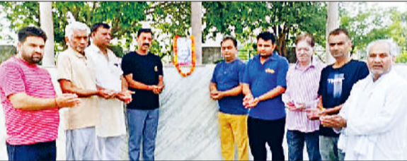
गोहाणा। तात्या टोपे के चित्र पर पुष्प अर्पित करते नागरिक।